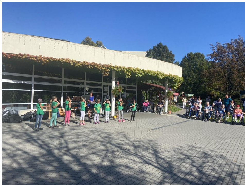
Vystoupení našich žáků pro seniory, září 2021