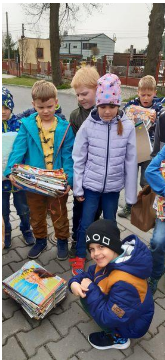
Tradiční akce – Sběr papíru, pořádaná 2 x ročně