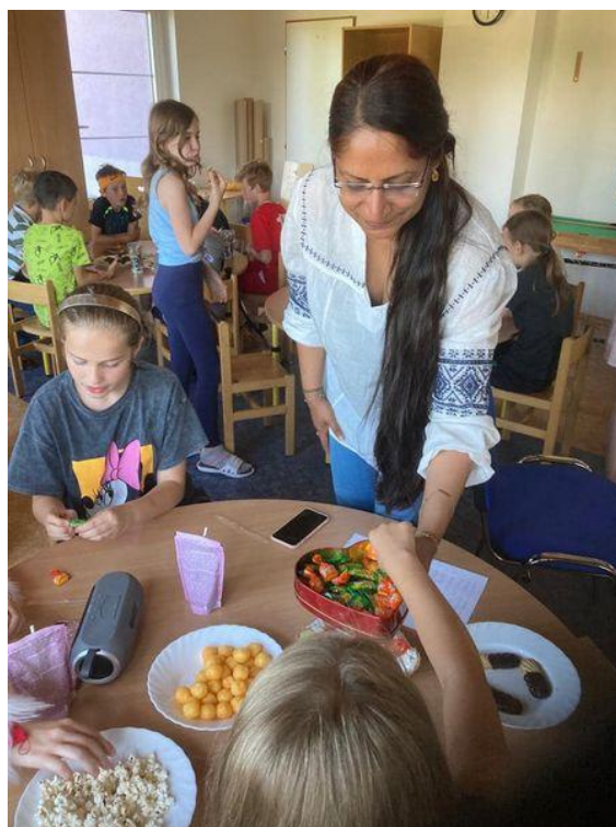
Výuka anglického jazyka s rodilou mluvčí