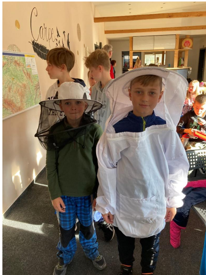
Projektový den – Včelí stezka na Vaňkově kopci