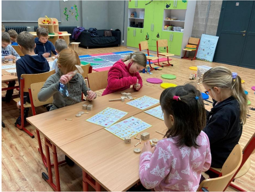
Exkurze do světa techniky