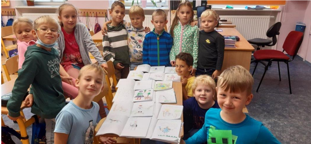
Projektový den Svatý Václav, září 2021