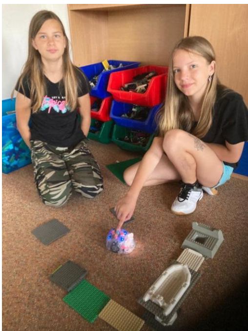
Zavádění „nové informatiky“ do výuky, výuka robotiky