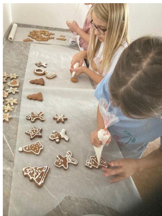
Střípky z výuky