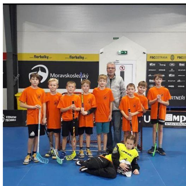
Účast na sportovní soutěži Floorbal Cup