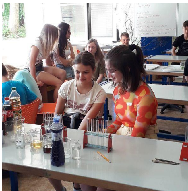
Spolupráce se ZŠ a MŠ Velká Polom – badatelské dopoledne pro žáky 5. ročníku