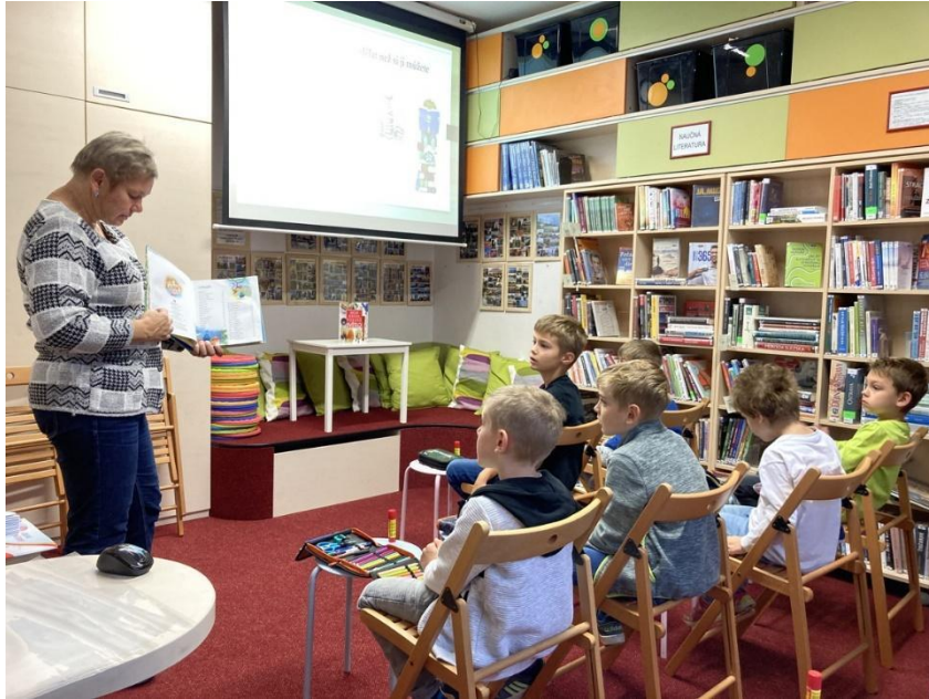
Návštěva vřesinské knihovny