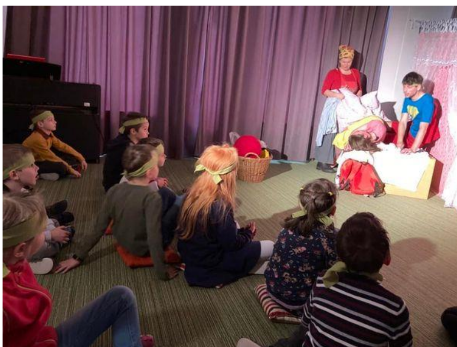
Návštěva Divadla loutek v Ostravě