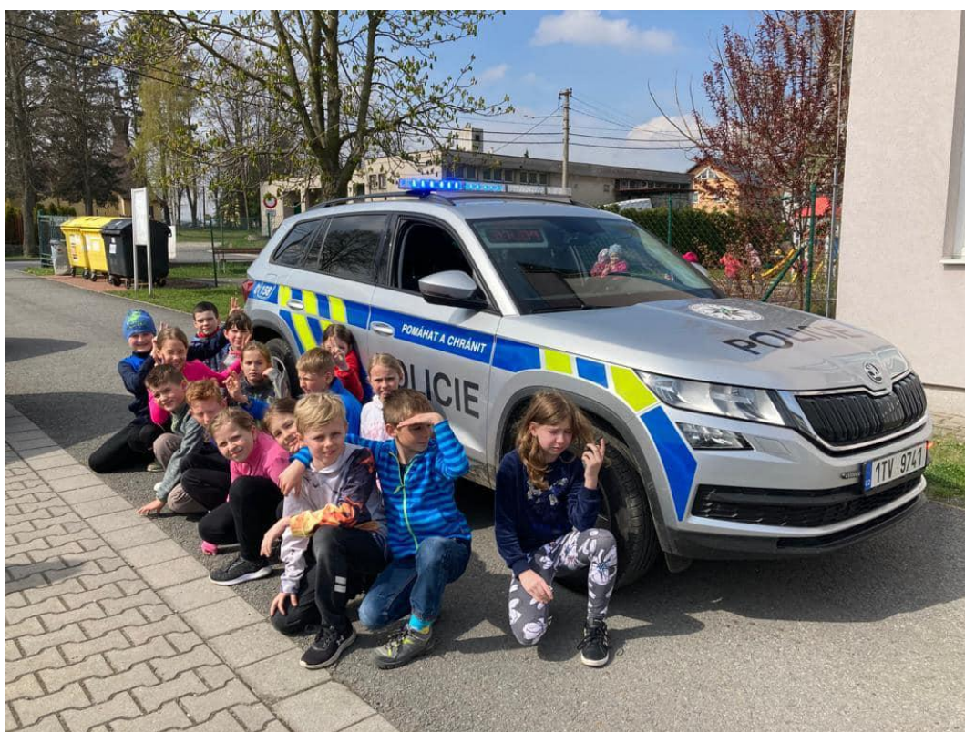
Spolupráce s Policí ČR Velká Polom