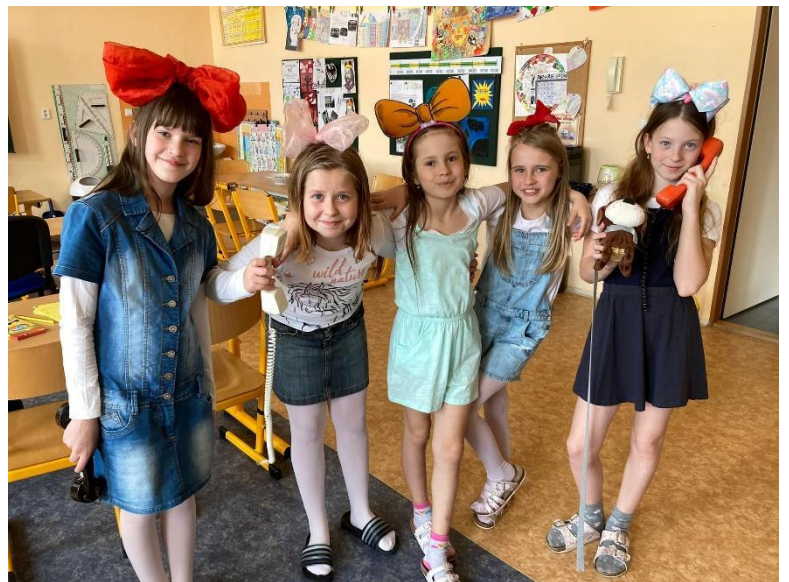
Zápis do 1. třídy