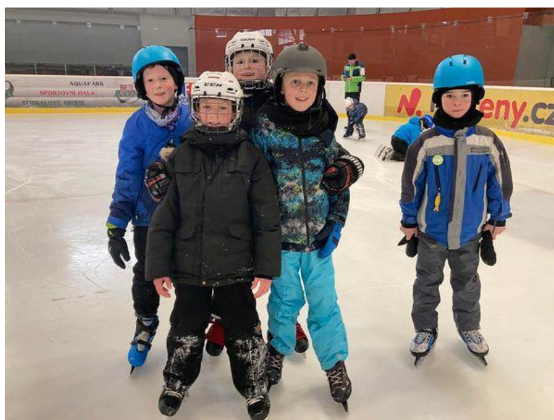
Bruslení v Kravařích – odměna za vysvědčení