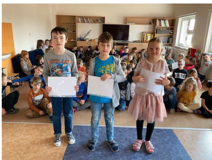
Vítězové matematického klokana